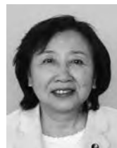
日本共産党豊橋市議員 鈴木みさ子 議員