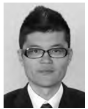
自由民主党豊橋市議団

答 豊橋市子ども会連絡協議会活動は、子どもたちの健全育成はもとより、地域活動の活性化にも大きな役割を果たしてきたと認識していますが、加盟する校区は減少しており、限られた校区のみを対象に活動している現状は課題だと認識しています。豊橋市子ども会連絡協議会か