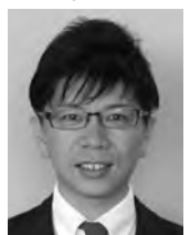
豊橋だいすき会 長坂尚登 議員

答 個人情報取り扱いについて、多くの場合、記録が残る方法での同意は得ていません。教職員が、勤務時間内に、PTA活動の事務を行うことは適切ではないと考えます。また、会員獲得の案内を校長名で出すことは、誤解を与える可能性があります。慎重に判断する必要があります。さらに、業務委任契約は、校務の範囲を超えていないか慎重に見定めていく必要があると考えます。