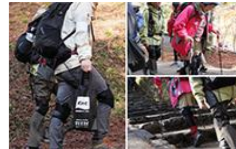
「着るロボット」で歩行をサポートするツアーの実施

中部地域の皆様に夢ある旅行商品をお届けすると共に、旅行を通して様々な課題解決をお手伝いし、「笑顔あふれる社会」の実現を目指して挑戦し続けます。