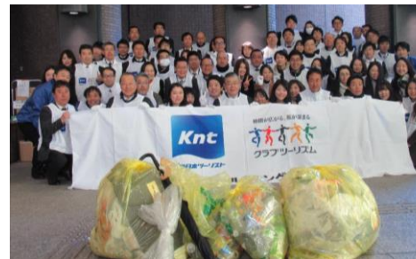
全国一斉 ゴミゼロ大作戦の取り組み