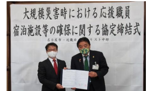
大規模災害時における宿泊施設等の確保