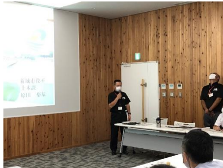
〈開催挨拶 熊谷副部長〉