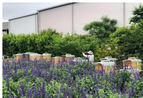
○自社ファームでの養蜂活動