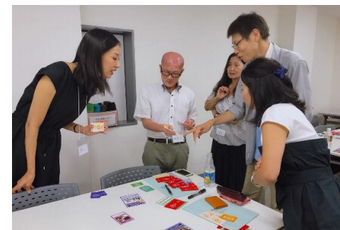
○SDGs実装支援コンサルティング