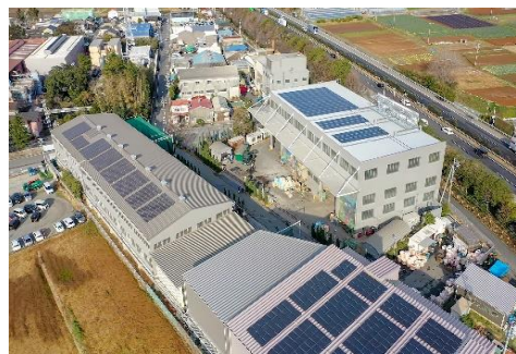
○太陽光パネルを設置した当社工場外観