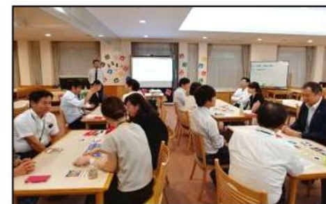
中小企業におけるSDGsセミナー