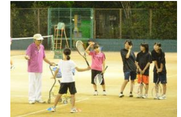
ソフトテニス教室