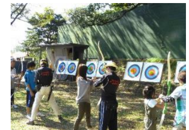
アーチェリー体験会