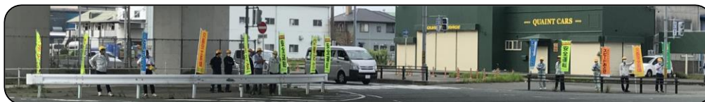
交通安全街頭活動