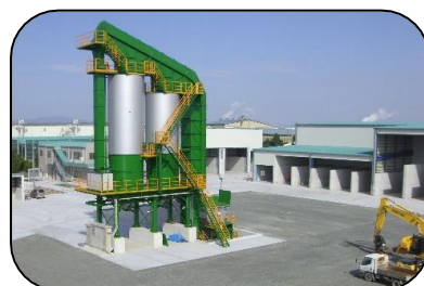
リサイクルプラント