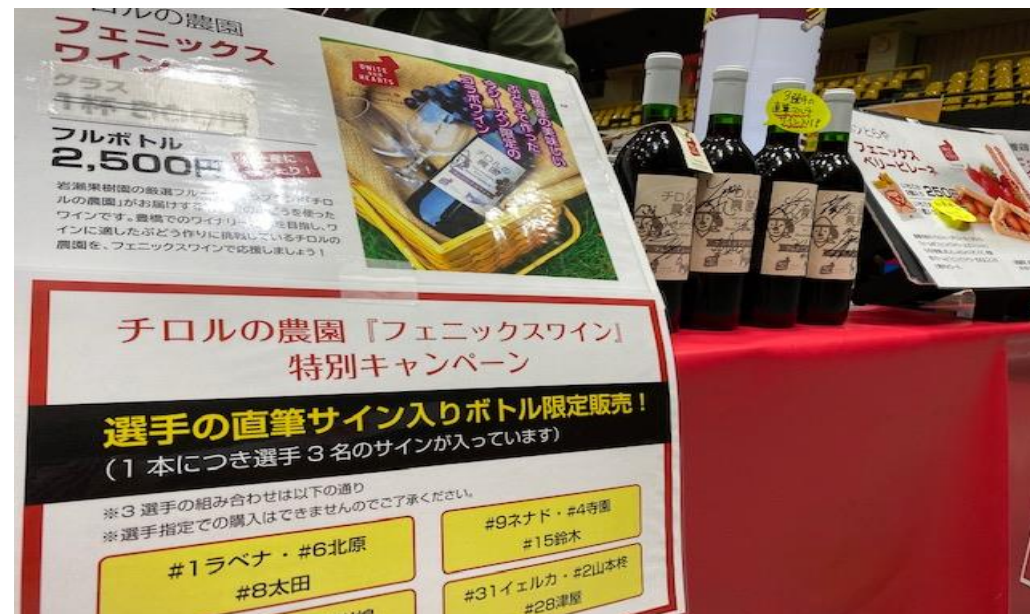
三遠ネオフェニックスの試合会場でワインを販売しながら豊橋初のワイナリー設立をPR