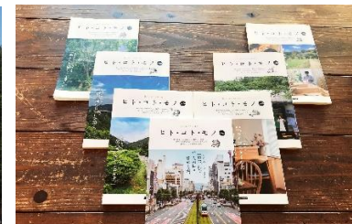
地域の人々との繋がりを大切にし、豊 かなまちづくりのためにフリーペーパー