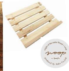
建築端材を利用して 新しい価値を生み出 すwoopシリーズ