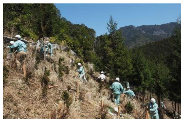
美しい穂の国の山々を守るための植 林活動