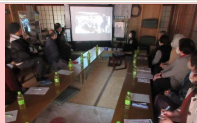
R6.3.13 地域ケア会議 みんなで「まりさん家」の映像を見ました