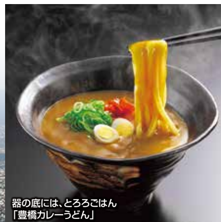
器の底には、とろろごはん