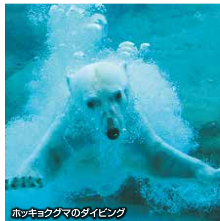
ホッキョクグマのダイビング

動物園、植物園、遊園地、自然史博物館が一体化した総合動植物園。情報番組はもちろん、映画のロケ地としても多く使われています。