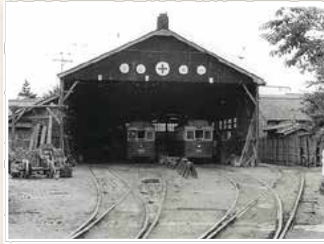
昭和の赤岩口車庫