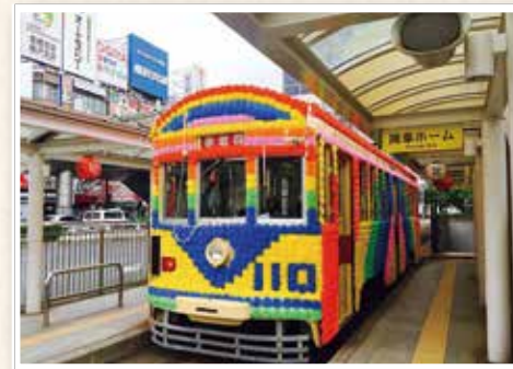
平成28年の市制110周年を記念する花電車