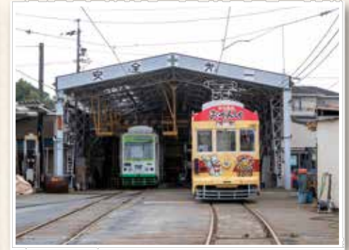
令和の赤岩口車庫

市電と共に育ってきた、豊橋生まれ・豊橋育ちの女性。 車窓から望める豊橋ならではの風景に浸る！