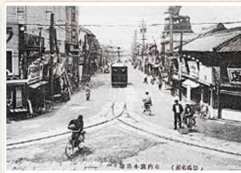
広小路通りを走る市電