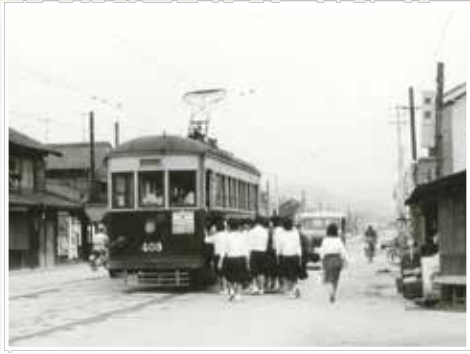
東田電停と乗り込む学生