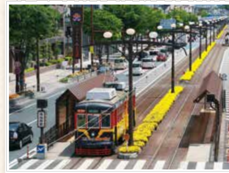
市役所前電停と咲き誇る花