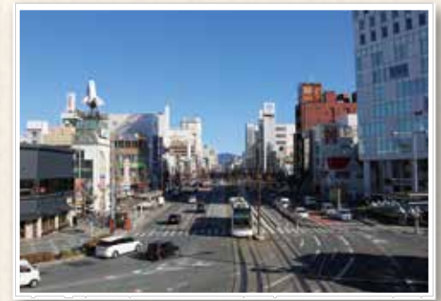
ペDESTリアンデッキからの風景