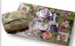
のんほいパークで購入した缶バッジ、ファイル、ポーチは、いつも持ち歩いている。