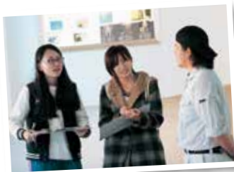
「のんほいパーク盛り上げ隊！」は、自ら足を運び、飼育員に取材をする。

気付くと1時間も見ているそうです。「2頭のカバが寄り添って寝る姿を見るだけでも癒やしますが、バタフライをしているようにプールを進む時もあり、レアな姿を見られた時は特別感がありますね。」就職してからも、休日はのんほいパークへ出掛けてお気に入りの動物を一日中チェックすることを欠かしません。「『今日、この子はどんな気分かな』と表情や行動を読み取りながら、写真を撮っています。何度も通うからこそ、人間味あふれる動物の素顔が見えて、愛着が増えますね。』