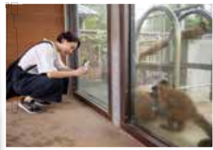
お気に入りの動物に話し掛けながらパチリ！