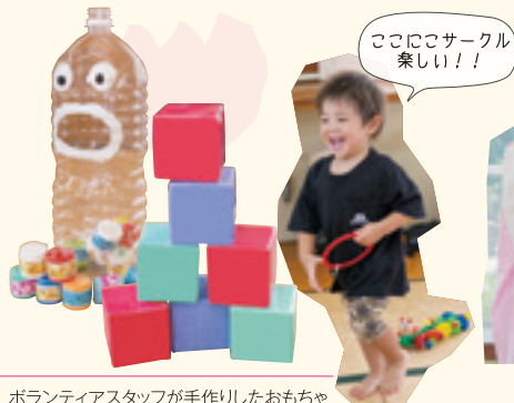
ボランティアスタッフが手作りしたおもちゃ