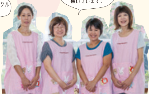
ここにこサークル ボランティアスタッフのみなさん