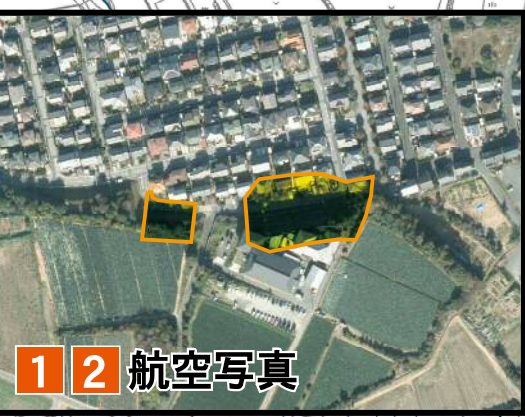
1 2 航空写真