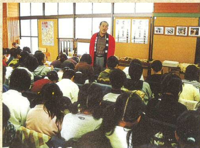
市内の小学校における筆作り実演授業

筆の良否は、材料とともに筆師の技術能力にかかっていますが、豊橋筆は優秀な筆師に恵まれ、伝統工芸士には13人が認定されています。しかし、企業規模としては零細な家内工業が多く、業界の高齢化も進んでいるため、後継者の確保と育成、原材料の保存と品質の向上などに積極的に取り組んでいます。