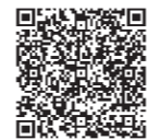
健診結果閲覧方法

ログイン後の健診結果の閲覧については、右記の二次元コードもしくは、 https://www.city.toyohashi.lg.jp/secure/108285/mainakenshinkekka.pdf から、ご確認ください。